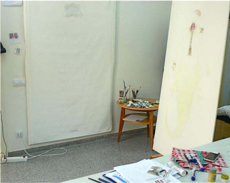
Obra en proceso